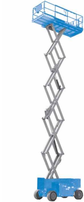
07/15 Ersatzteil Nr. B127292DE